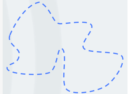
Profi-Tour ca. 110 Kilometer

Ob gemütliche Mini-Tour bis maximal 10 Kilometern, Familien-Tour, Aktiv-Tour, Sport-Tour oder die anspruchsvolle Profi-Tour mit rund 110 Kilometern Länge – das LVZ-Fahrradfest bietet für jedes Niveau die passende Strecke. Diese Vielfalt spricht alle Generationen und Fahrstile an: vom kleinen Nachwuchsfahrer über Familien bis hin zu ambitionierten Sportlern. Damit schaffen wir nicht nur ein besonderes Erlebnis für Teilnehmende, sondern auch eine breit gefächerte, aufmerksamkeitsstarke Zielgruppe für Sie als Partnerinnen und Partner.