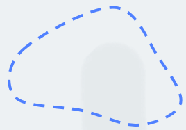
Mini-Tour max. 10 Kilometer