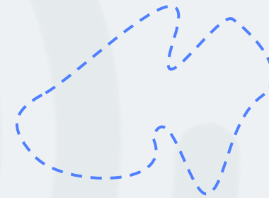
Sport-Tour ca. 80 Kilometer